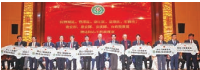
捐贈九部同心工程救護車予泉州地區的九個縣市區