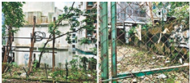
■現時H19項目內有唐樓外牆豎立鋼支架(左圖)及石屎牆防止地基石土流失(右圖)，但年代已久，需作檢視。網誌圖片

除為現存樓宇進行復修，韋志成表示，市建局會翻新項目內已收購的住宅單位，作居住用途。其中位於士丹頓街60號至62號唐樓的6個單位，