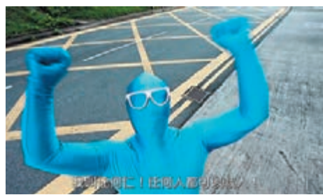
■特區政府消防處的「任何仁」系列視頻除了傳授急救知識外，還是學習粵語的有趣素材。

港珠澳大橋、廣深港高鐵香港段的開通，拉近了香港和內地地理上的距離，而「港言港語」更像一條紐帶，拉近了中聯辦員工和香港同胞的心理距離。為了繼續