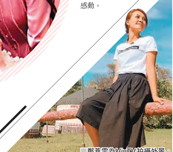
鄭萃雯為ViuTV拍攝外景。