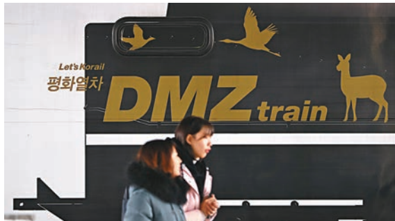
■韓國一輛寫有「和平號」的列車。

朝韓4月簽署《板門店宣言》時，就雙方鐵路與公路對接和現代化項目達成共識，並同意在共同考察結束後，於本月底或下月初舉行動工儀式。美國與朝鮮在6月舉行歷史性峰會，令半島局勢出現突破，但華府與平壤的無核化談判陷入僵局，導致朝韓鐵路計劃受阻。