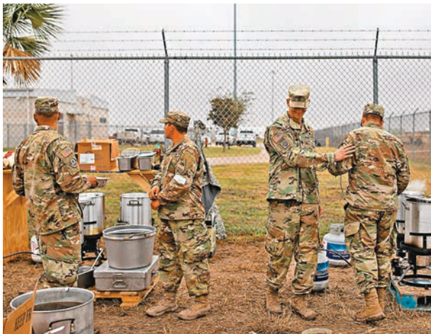
■總統特朗普要求禁止跨性別人士參軍遭受司法挑戰，前日繞過上訴法院，直接提請最高法院要求作出裁決。圖為駐紮美國墨西哥邊境基地的美軍士兵。