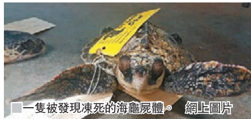
■一隻被發現凍死的海龜屍體。

美國環保團體麻省奧杜邦協會前日表示，近日於科德角海岸發現近190隻海龜屍體，相信牠們在遷徙至美國時遇到潮漲，在嚴寒海水下無法活動，結果活活凍死。