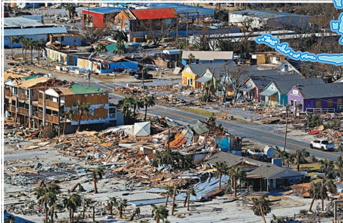
■今年10月遭受颶風邁克爾吹襲後，佛羅里達州海灘滿目瘡痍。