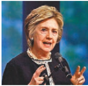
■希拉里前日澄清其移民觀點，指是希望歐洲進行改革。

希拉里在貼文中指，在近日的訪問中，她談及歐洲必須對抗右翼民族主義及極權主義，包括在移民問題上表現出勇氣及同情心，強調不論美國及歐洲，均需就移民問題改革，「我們不能讓恐懼及偏見，迫使我們放棄令民主制度變得偉大及美好的價值。」