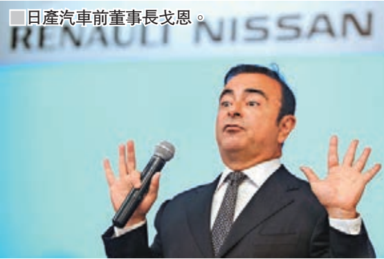
■日產汽車前董事長戈恩。