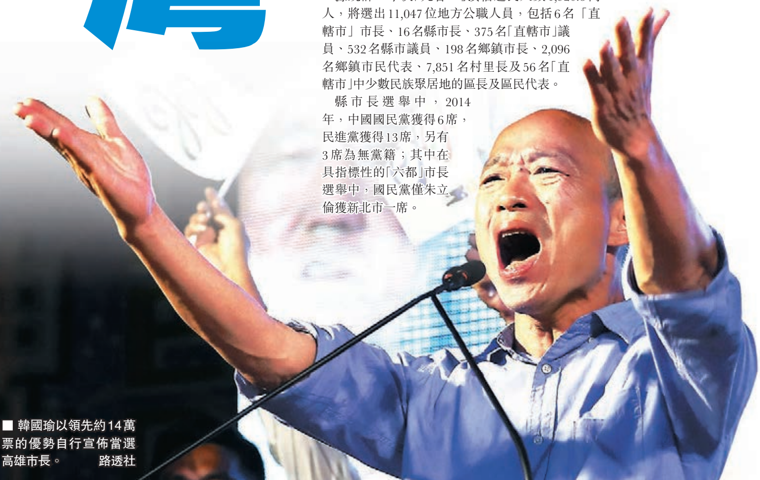
■韓國瑜以領先約14萬票的優勢自行宣佈當選高雄市長。

縣市長選舉中，2014年，中國國民黨獲得6席，民進黨獲得13席，另有3席為無黨籍；其中在具指標性的「六都」市長選舉中，國民黨僅朱立倫獲新北市一席。