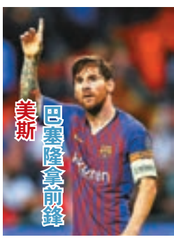
美斯 巴塞隆拿前鋒

西甲於本港時間周日凌晨安排大戰，由馬德里體育會於主場迎戰巴塞隆拿。前者近績雖好，但場上表現其實不算特別有霸氣，今面對強勁的巴塞未必可佔得優勢，形勢上巴塞更值得看高一線。(now632台周日3:45a.m.直播)