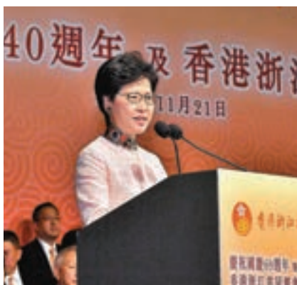
▲林鄭月娥於晚會上致辭。

她讚揚浙聯會堅定擁護「一國兩制」和基本法,支持特區政府依法施政,關心社會事務,是特區政府的堅實夥伴,並感謝浙聯會的貢獻,希望今後繼續與浙聯會同心攜手,為市民謀求更大福祉。