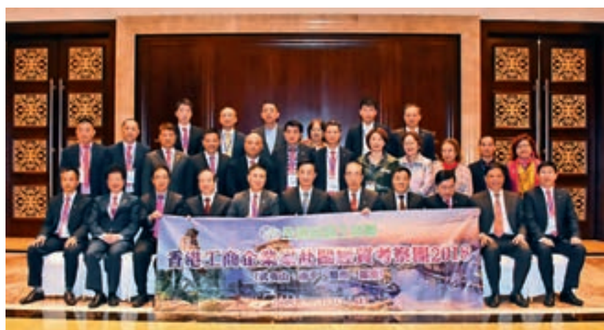
考察團拜訪福建省政協港澳辦外事委員會領導時合照