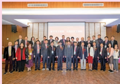
考察團拜訪南平市政府領導時合照