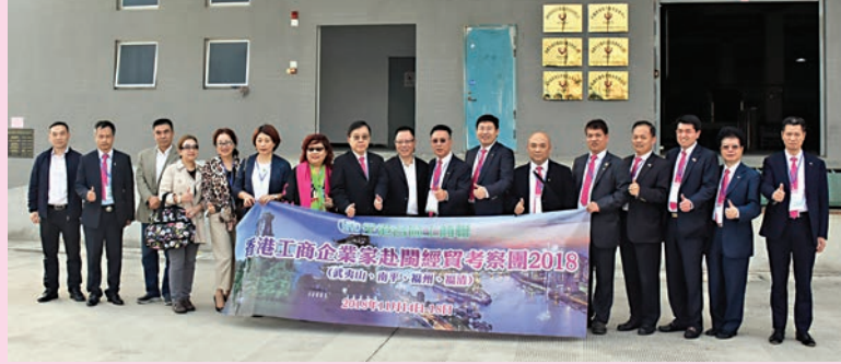
團員參觀考察福州保稅港區國際物流園區的建設成就