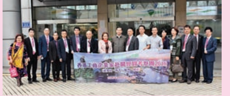
團員考察福建自貿區福州片區