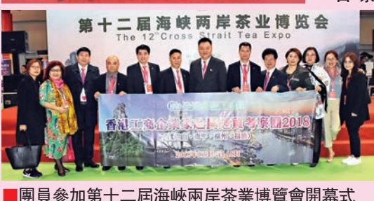
團員參加第十二屆海峽兩岸茶業博覽會開幕式