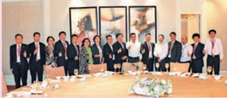
考察團拜訪福清市市委常委、統戰部部長陳存楓領導時合照。