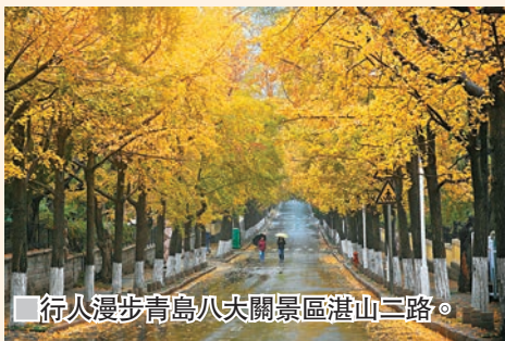
■行人漫步青島八大關景區湛山二路。