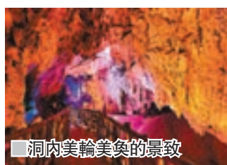
■洞內美輪美奐的景致

王母用金簪劃出銀河分隔兩人，織女鬧得連地上的石頭都翻到天上去了，後被關在天牢裡，眼淚流成了「相思淚瀑」。