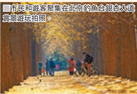
■市民和遊客聚集在北京釣魚台銀杏大道賞景遊玩拍照。