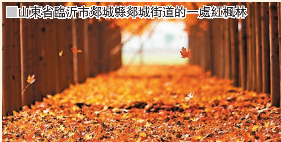
■山東省臨沂市郯城縣郯城街道的一處紅楓林