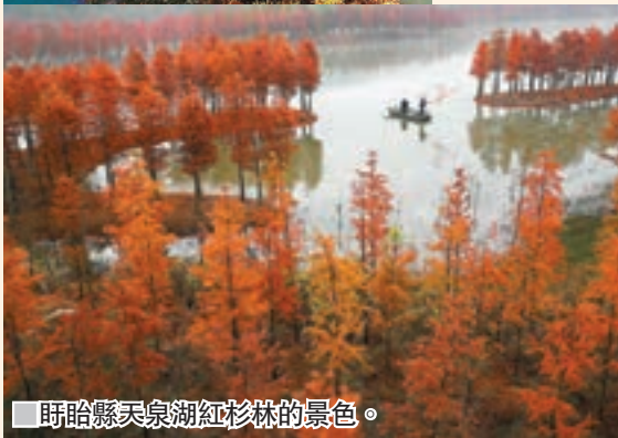
■盱眙縣天泉湖紅杉林的景色。

時值初冬，山東省臨沂市郯城縣郯城街道一處紅楓林落葉滿地，片片楓葉無聲飄落，呈現出寂靜之美。安徽省黃山市黟縣塔川村落層林盡染，美不勝收。而杭州市西湖景區則色彩斑斕，別有一番韻味。同時，江蘇省淮安市盱眙縣天泉湖內的紅杉林枝葉飄紅，盱眙縣天泉湖紅杉林的景色，同樣別有韻味。