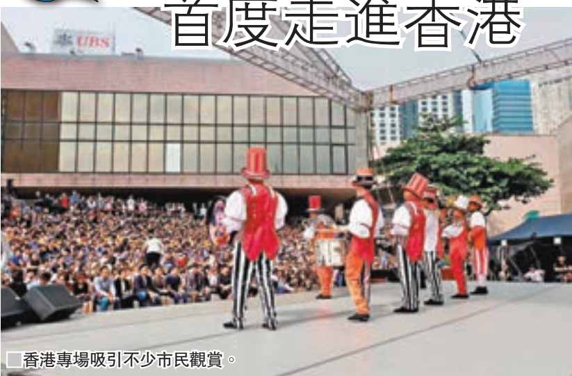
■香港專場吸引不少市民觀賞。

早前，第五屆中國國際馬戲節香港專場於尖沙咀香港文化中心露天廣場舉行，來自世界各地的馬戲藝術團隊，包括菲律賓、阿根廷、烏克蘭、俄羅斯、肯尼亞和意大利等，為香港市民帶來技驚四座的震撼演出。今次，馬戲節目極具創意又多元化，巧妙結合西樂及喜劇表演，提升了香港市民的藝術修養，希望透過節目讓每位參與者可欣賞到馬戲盛宴，認識馬戲情節，了解馬戲文化，從而提高欣賞藝術、創作和表達的能力。