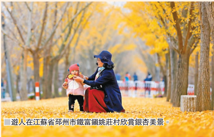
■遊人在江蘇省邳州市鐵富鎮姚莊村欣賞銀杏美景。