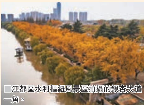
■江都區水利樞紐風景區拍攝的銀杏大道一角。

最後，在秋冬交替之際，青島八大關景區迎來一年中最佳賞葉期，當中行人更雨中漫步於青島八大關景區湛山二路。據悉，截至12月底，八大關景區在晴朗無風的天氣將不再打掃落葉，讓遊客盡情欣賞「金葉」遍地的初冬之美。