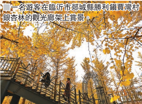
■一名遊客在臨沂市郯城縣勝利鎮賈灣村銀杏林的觀光廊架上賞景。