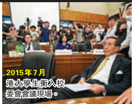
2015年7月 港大學生衝入校委會會議現場。

香港文匯報訊（記者 姬文風）在最新公佈的《IMD世界人才報告》中，香港的大學教育排名明顯被勁敵新加坡拋離。若要數本港大學近年環境變遷，最明顯當屬校園政治化問題日趨嚴重，從衝擊校委、禁錮及辱罵師長以至校園播「獨」，行為激進程度有增無減，個別甚至觸及法律底線，嚴重影響校園安寧，對於吸引人才留港自是百害而無一利。