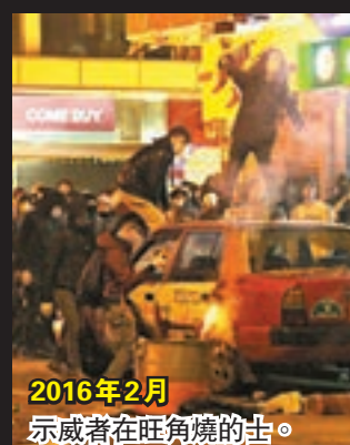
2016年2月 示威者在旺角燒的士。

這些與國家背離的「港獨」主張及大型違法事件，都令人憂慮香港的政局不穩，從而削弱人才來港或留港發展的信心。