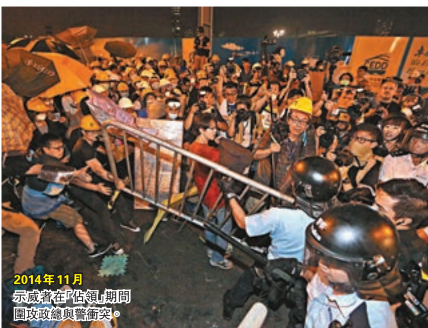
2014年11月 示威者在「佔領」期間圍攻總督與警衝突。

反對派自回歸以來，接二連三到外國「唱衰」香港，稱香港「一國兩制」有「危機」、各項自由受「衝擊」、司法獨立「保不住」云云，除了令別有用心外國勢力，往往加以一唱一和，不時刊出所謂「報告」去對香港的人權和法治狀況等說三道四，打擊香港國際形象外，也令部分不知就裡的外國人士，對香港產生誤解，嚴重影響各地人才的來港意欲。