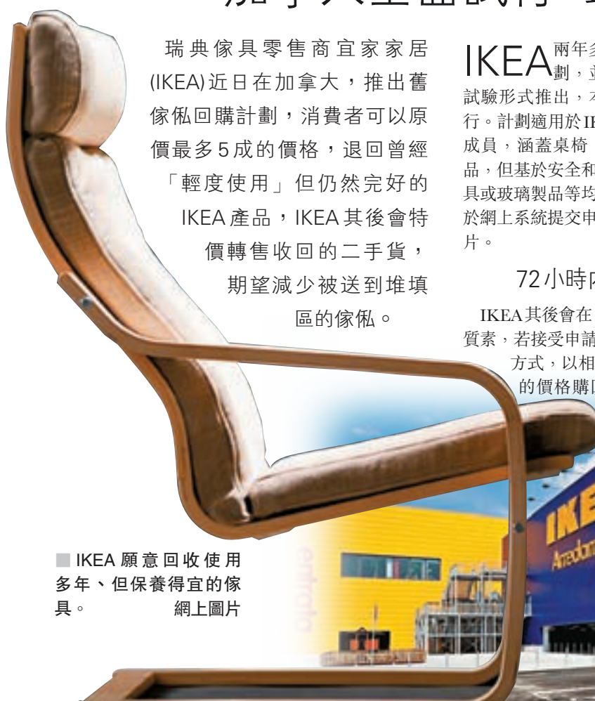
■IKEA願意回收使用多年、但保養得宜的傢俬。網上圖片