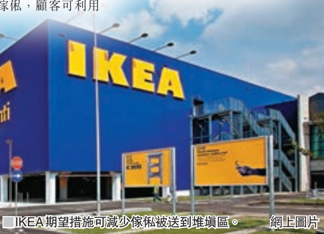
■IKEA期望措施可減少傢俬被送到堆填區。網上圖片