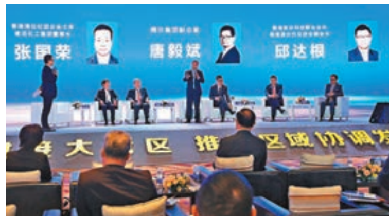
▲2018粵港澳合作論壇在清遠舉行，12個項目落地清遠助推當地「融灣」發展。