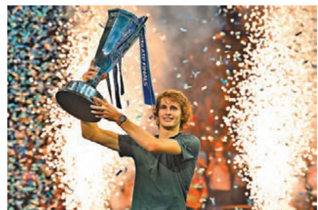
■阿歷山大施華利夫高舉年終賽冠軍獎盃。

儘管錯失追平費達拿六奪年終賽桂冠紀錄的機會，世界排名一度掉到了第22的祖高域還是在下半年上演了王者歸來，自溫網開始後僅輸三場。