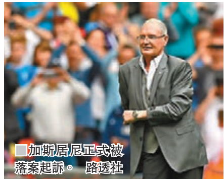
■加斯居尼正式被落案起訴。