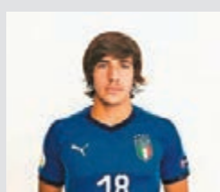
■東拿利的外形也有點派路的影子。

明晨意大利會在比利時友賽對陣美國(有線601及661台周三3:45a.m.直播)，日前歐國聯贏形勢卻被葡萄牙摸和，預料意大利今仗會以練兵為目的，或會試用恩莫比尼、恩斯治尼和費達歷高基艾沙的三箭頭之外的另一些攻擊組合，而