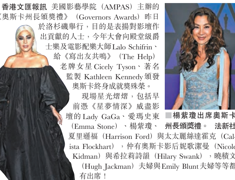
楊紫瓊出席奧斯卡

袁富華又在訪問中特別感激老閩古天樂，原來他在獲獎後曾與古天樂通電話，更指二人在電話中都十分激動，古天樂也替他高興。袁富華指十分敬佩古天樂又出錢、又肯拍《翠絲》這一類型的題材電影，古天樂更給予很大的創作自由給團隊，很少給意見，令他們有發揮的空間。問到獲得金馬獎後是否增加了奪金像獎的信心？袁富華則表示不太在意獎項，他表示若只是在想能否得獎，會很痛苦的。