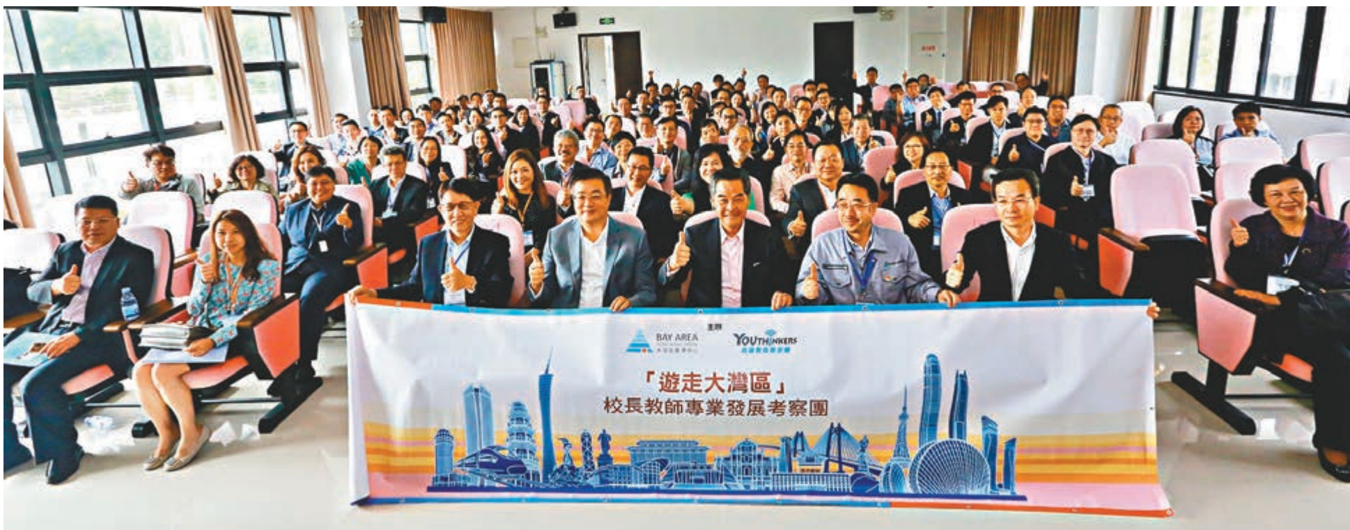
逾百名香港學校校長及老師參加「遊走大灣區」專業發展考察團。

香港文匯報訊（記者 詹漢基）隨着高鐵香港段、港珠澳大橋等基建陸續開通，大灣區間交流日益增加。為豐富教育界相關認知，由大灣區香港中心安排的首個校長教師專業發展考察團昨日出發，成員包括逾百名來自不同學校的教師及校長，首站經港珠澳大橋前往珠海，並獲安排由大橋總工程師講解大橋工程資料及解答疑問，他們隨後並有機會參觀區內的國家級科技基礎設施及科技文創業。全國政協副主席、大灣區香港中心主席梁振英在啟動禮上寄語各校長、教師，回校後要將所見所聞所思與學生分享，幫助新一代開拓更大發展空間。