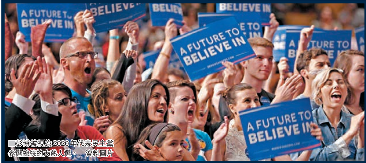
■ 彭博被視為2020年代表民主黨參選總統的大熱人選。資料圖片