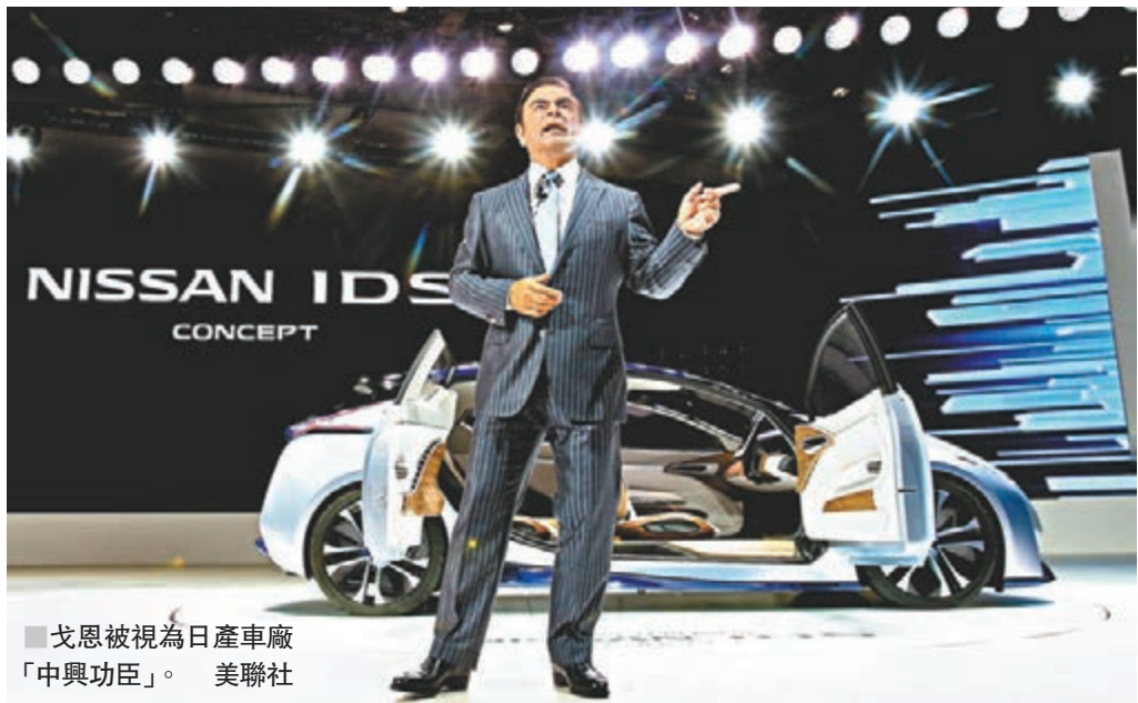
■ 戈恩被視為日產車廠「中興功臣」。

被視為日本日產車廠「中興功臣」的董事長戈恩，涉嫌虛報酬金和挪用公司資產，違反日本金融商品交易法，昨日被東京特別搜查部拘捕。由於戈恩同時擔任法國雷諾車廠董事長兼行政總裁、三菱汽車董事長及雷諾日產三菱聯盟董事長兼行政總裁，消息一出立即轟動日本和法國兩地，法國總統馬克龍表示政府作為雷諾股東之一，對事件深表關注，日產社長西川廣人則建議董事會解除戈恩的董事長職務。消息亦拖累日產在德國掛牌的存託憑證急跌12%，雷諾股價昨日中盤亦跌超過一成。