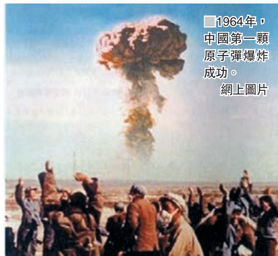
1964年，中國第一顆原子彈爆炸成功。