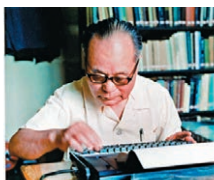
程開甲在打字機上撰寫論文。資料圖片