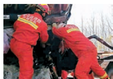
救援人員在事故現場實施救援。

香港文匯報記者從平輿縣委宣傳部了解到，昨日上午7時27分，在大廣高速河南駐馬店平輿楊埠收費站南約2公里處，發生28輛大貨車連環相撞，截至當日12點，事故共有11人送往醫院救治，其中3人確定死亡，現場救援正在進行。事故發生後，平輿縣全力以赴搶救傷員，積極做好善後處理工作。