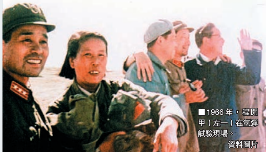
1966年，程開甲（左一）在氫彈試驗現場。