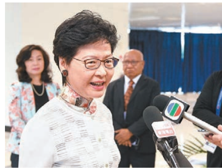
林鄭月娥昨日在巴布亞新幾內亞莫爾茲比港會見記者。