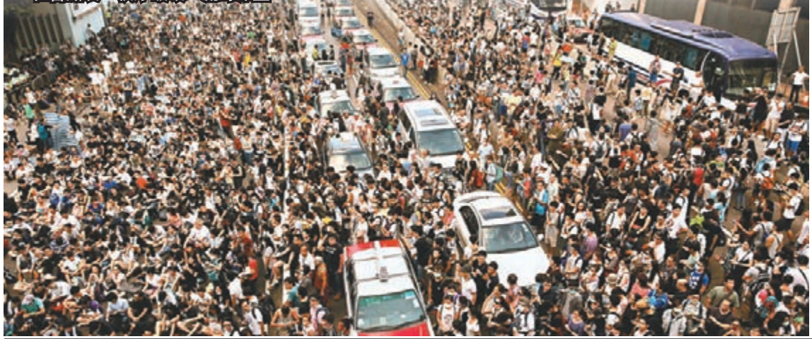
2014年9月底，「三丑」發起非法「佔中」終以失敗收場。歷時79日「佔中」造成社會撕裂，秩序破壞，流毒深重。