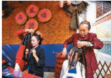
■11月17日，媽祖故里福建省莆田市湄洲島舉辦湄洲女髮髻技藝表演賽。

香港文匯報訊 據中新社報道，第二十屆湄洲媽祖文化旅游節於近日在「媽祖故里」福建莆田開幕，吸引了60多家台灣宮廟的逾百名信眾，以及60個國家和地區的相關學者、僑領代表出席。