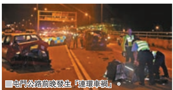
屯門公路前晚發生「連環車禍」。

香港文匯報訊(記者 蕭景源)屯門公路發生連環車禍。前晚一輛外賣電單車與的士發生輕微碰撞意外後，雙方停在公路慢線處理期間，一輛駛至七人車收掣不及狂撞的士，的士被撞前憾向電單車，電單車司機走避不及被撞重傷昏迷，送院命危。警方拘捕肇事七人車司機及調查車禍原因。