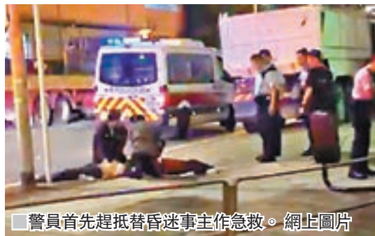
警員首先趕抵替昏迷事主作急救。網上圖片