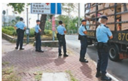
大批警員在瑪麗醫院對開薄扶林道搜索走犯。