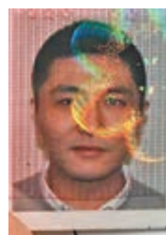
越柙疑人持有多明尼加身份證。