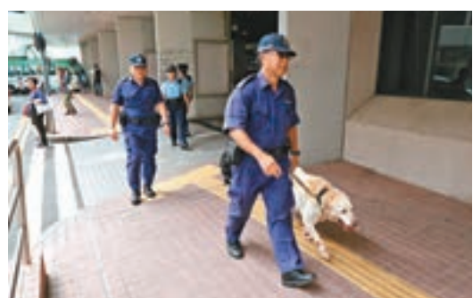
警方召來警犬到醫院搜尋越柙疑犯。