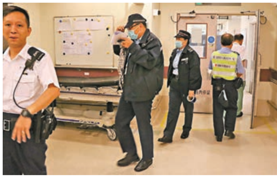
警員在疑犯病床檢走遺下的犯人鏈。

香港大學就瑪麗醫院拘留犯逃脫事件回應，港大會配合警方搜查及保持密切聯繫，以了解事件對大學的可能影響。港大亦以電郵通知大學教職員及學生，呼籲大家保持警惕，如發現任何可疑者，應立即通知大學或向警方舉報。