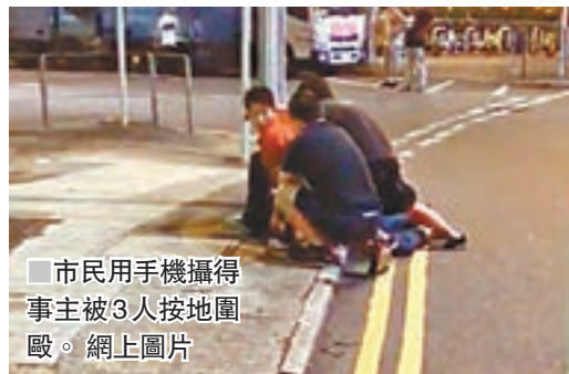
市民用手机攝得事主被3人按地圍毆。網上圖片