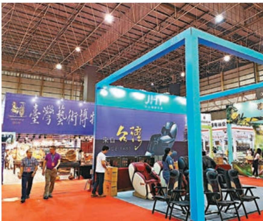
本屆台博會吸引了169家台資企業參展。圖為台博會現場。

香港文匯報訊（記者帥誠東莞報道）昨日在東莞開幕的2018台灣名品博覽會（下稱「台博會」）有169家台資企業參展。展廳分為電商、惠台政策、兩岸農業科技等主題展區，其中，松山湖創基地數十個台灣創業團隊通過了解大陸市場，精準研發推廣靜音吉他、醒酒藥等創新產品，並依靠電商成功進入大陸市場。