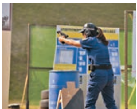
中國隊女隊員在賽場射擊。

大賽總裁判長阿蘭·喬利介紹，排名取決於槍手完成任務的耗時，用時最長者獲勝。本次比賽設10個賽局，賽場結合射擊競技與警務實戰，設置了模擬盤查遇襲、抓捕搶劫團夥等場景，所有場景均賽前保密，測出選手真水平。在14日先期進行的比賽中，白俄羅斯暫居第一。此次大賽，中國隊通過射擊比賽和集訓選拔，從全國各警種200多名優秀射手中選拔出4男4女組成中國一隊和中國二隊參加征戰。在14日先期進行的比賽中，中國、法國、匈牙利、捷克、中國香港、中國澳