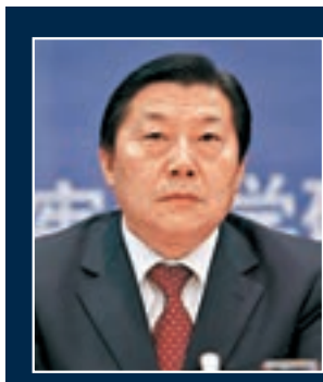
中宣部原副部長魯煒資料圖片

香港文匯報訊（記者王珏北京報道）「我的生活作風問題使她（魯妻）受到了很大傷害，我們經常為此吵架，她對我完全絕望，曾經悲憤地對我說：『我管不了你，但遲早共產黨會管你』。而今，正是一語成讖。」正在國家博物館舉辦的「偉大的變革——慶祝改革開放40周年大型展覽」，展出了包括中宣部原副部長魯煒在內的多名落馬高官的懺悔書手稿，魯煒在十餘頁的親筆書中反思了自己對黨不忠、對父母不孝以及生活作風對妻兒造成的傷害。