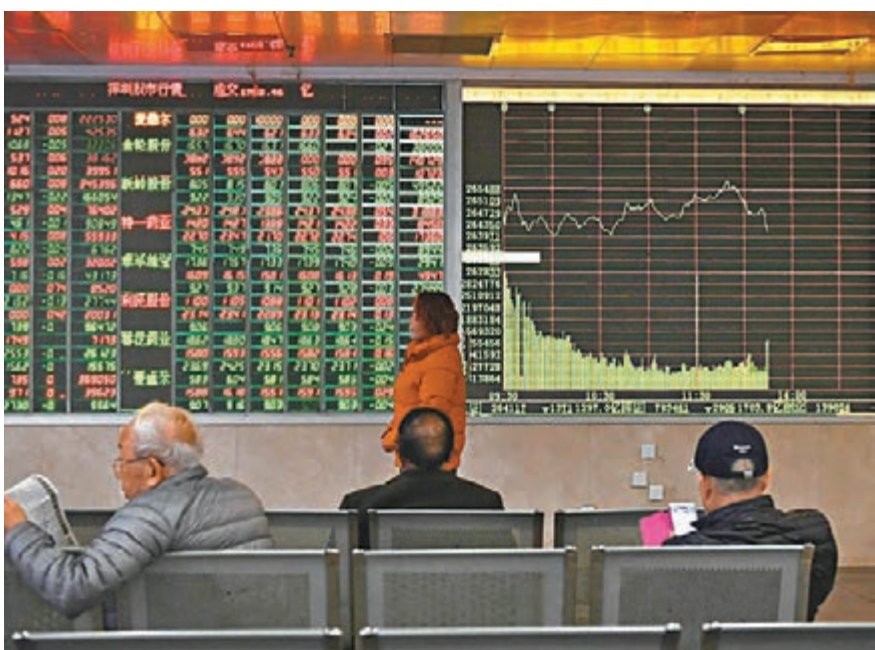
科創板傳出消息最快明年首季成事,惟未能提振A股,在人民幣走貶等因素下,滬深三大指數昨收線。 中新社

另據《中國證券報》報道,滬倫通經紀業務有望在12月8日上線。各家券商正在全力以準準備滬倫通業務方案,預計12月初完成全部系統測試。券商分析人士認為,雖然當前A股低迷,但滬倫通CDR的上市不會對A股形成「抽血效應」,分流資金的影響可控。昨日人民幣兌美元匯率中間價調升227個基點,結束4日連跌,但由於同日公佈的經濟數據不及市場預期,A股依然下行。早盤滬綜指低開0.25%,起先一直呈現窄幅震盪,臨近午盤做多氛圍向好,午後滬綜指一席成功翻紅,但在高