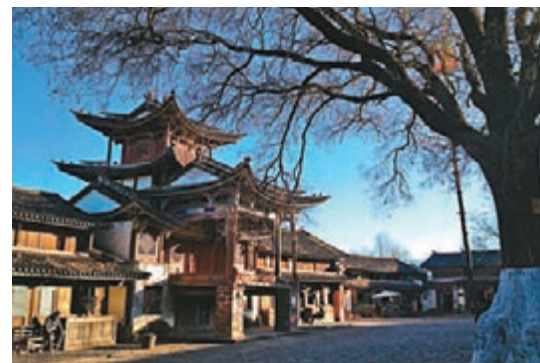
沙溪古鎮古色古香,至今仍然保持着最古老的建築特色。

列入雲南省特色小鎮創建名單的目前有99個。預計未來三年,省財政獎補資金將達70億元。