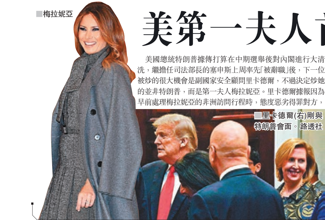
里卡德爾(右)剛與特朗普會面。