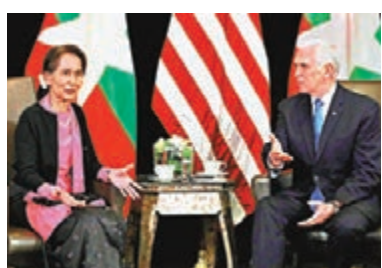
彭斯(右)在東盟峰會與昂山會面時「無面異」。