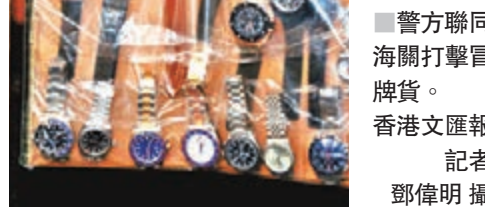
警方聯同海關打擊冒牌貨。

事非常小心，會採取多種措施以逃避執法人員偵查，當中包括只向外籍遊客兜售冒牌貨品，在確認他們不是執法人員後才會帶到預先租用的銷售中心和儲存倉挑選冒牌貨物。