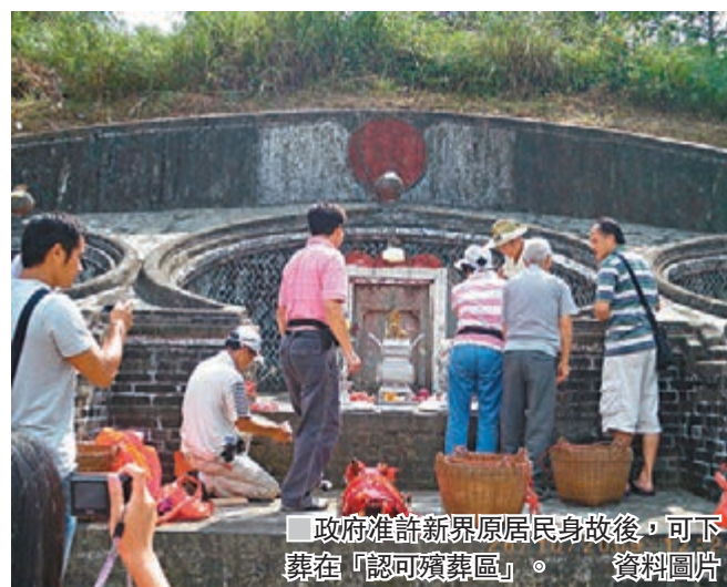
政府准許新界原居民身故後，可下葬在「認可殯葬區」。資料圖片

申訴署建議民政總署及地政總署，皆應派員與「許可證」持證人事先到「認可殯葬區」確認下葬的位置，並於下葬後再派員進行查核。