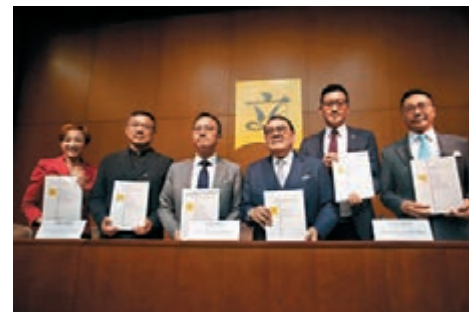
立法會政府帳目委員會發表報告，關注已復修墳區的管理及八號幹線沙田段工程問題。

兩署亦應考慮對違規者採取懲罰性措施，例如罰款，令有關違規者必須付出一定代價，以避免令公眾覺得某些「界外殯葬」的違規者可以獲得當局優待，無須為非法佔用政府土地付出代價。