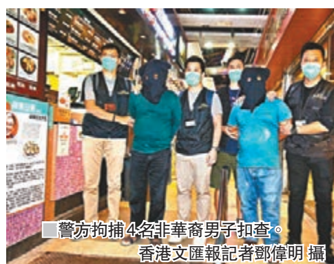
警方拘捕4名非華裔男子扣查。

及至昨午，尖沙咀警區特遣隊與海關版權及商標調查科人員認為時機成熟，決定採取聯合執法行動，突擊搜查兩個分別位於彌敦道84號至97號和漢口道43號至49A號的商住單位，當場檢獲455件包括手袋、手錶、皮帶和銀包等冒牌貨物，總值約66萬元。