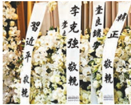
■ 習近平、李克強、韓正等分別致送花圈。