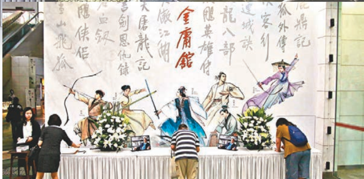
▲ 前來向金庸致意的人絡繹不絕。