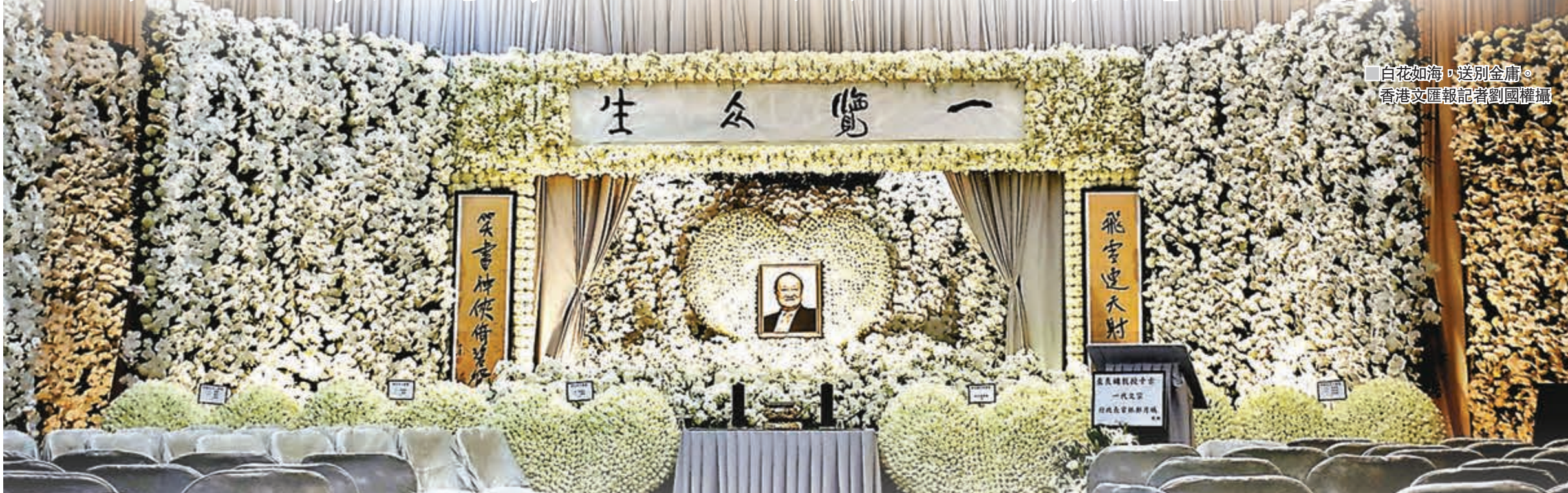
▲ 白花如海，送別大俠。

自花如海，送別大俠。《明報》創辦人、一代武俠小說泰斗查良鏞（筆名金庸）上月與世長辭，享年94歲，昨日傍晚於香港殯儀館設靈，今日出殯。國家領導人習近平、李克強、韓正等致送花圈（見頭上另稿）。喪禮以私人形式進行，不設公祭。靈堂佈置以白色為主，高掛「一覽眾生」橫匾，兩側輓聯為知名的「飛雪連天射白鹿 笑書神俠倚碧鴛」，概括了這位一代文學巨匠所寫的14部巨著。