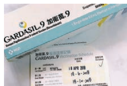
■ 政府計劃為特定年齡組群女學生提供HPV疫苗接種。資料圖片