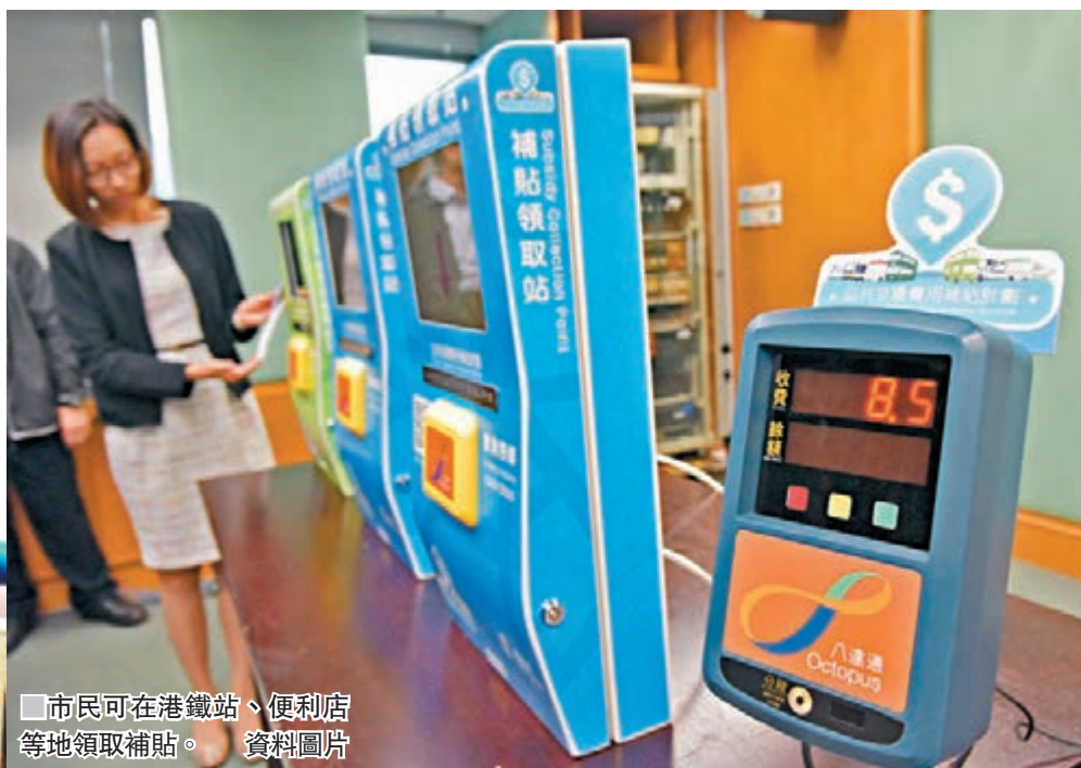
市民可在港鐵站、便利店等地領取補貼。資料圖片