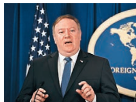
■ 蓬佩奧表示，美國將暫時允許8個國家和地區繼續購買伊朗石油。資料圖片

1. 有意見認為美國並未能提出實質證據證明伊朗違反協議，在此情況下恢復對伊朗的制裁是於理不合，你認同這個觀點嗎？