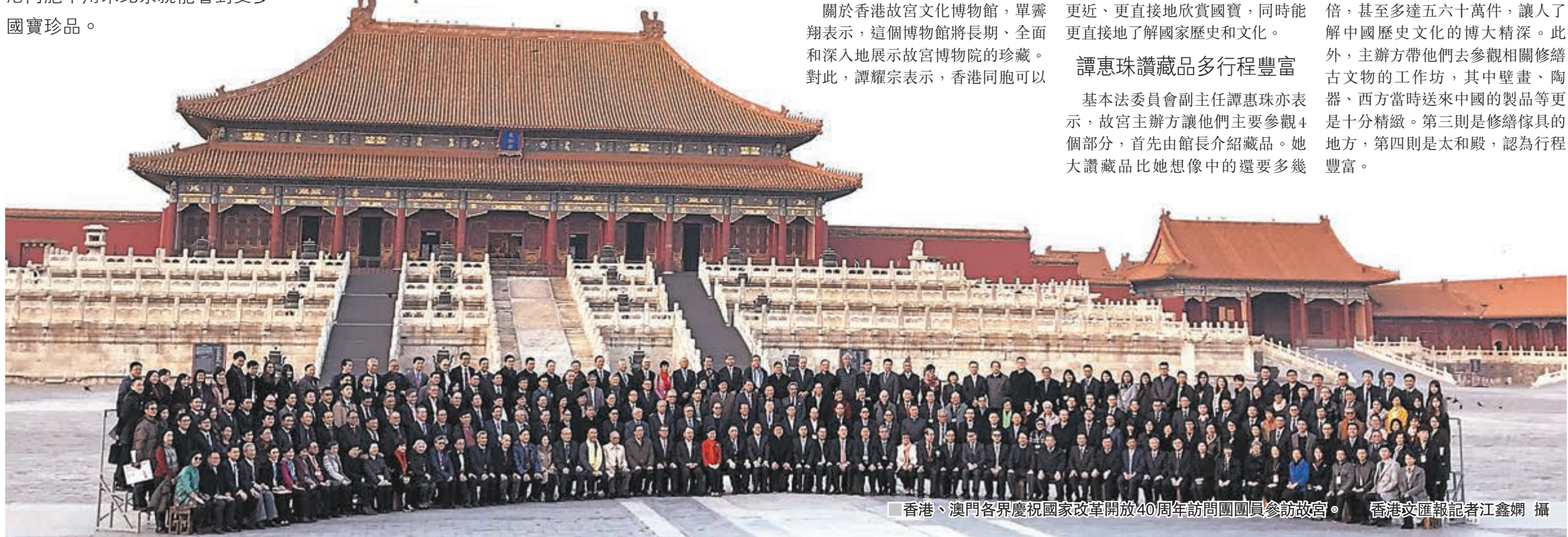
香港、澳門各界慶祝國家改革開放40周年訪問團團員參訪故宮。

倍，甚至多達五六十萬件，讓人了解中國歷史文化的博大精深。此外，主辦方帶他們去參觀相關修繕古文物的工作坊，其中壁畫、陶器、西方當時送來中國的製品等更是十分精緻。第三則是修繕傢具的地方，第四則是太和殿，認為行程豐富。