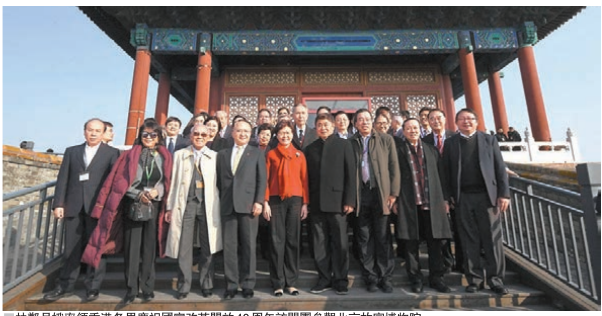
林鄭月娥率領香港各界慶祝國家改革開放40周年訪問團參觀北京故宮博物院。

譚耀宗：管理水平大提升 譚耀宗在接受香港文匯報訪問時表示，以前他也曾到過故宮，但今次參觀的幾個點都是從未去過的。「我的總體感受是，故宮的管理水平有了很大提升。」他說，通過參觀文物醫院，發現加強文物修復的科研實力、加大人才培養等，都利於傳承和弘揚中華優秀傳統文化。