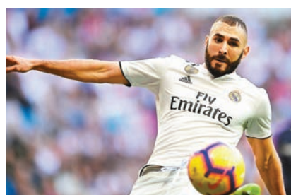
■皇馬前鋒 實施馬過去幾仗漸見重拾信心。