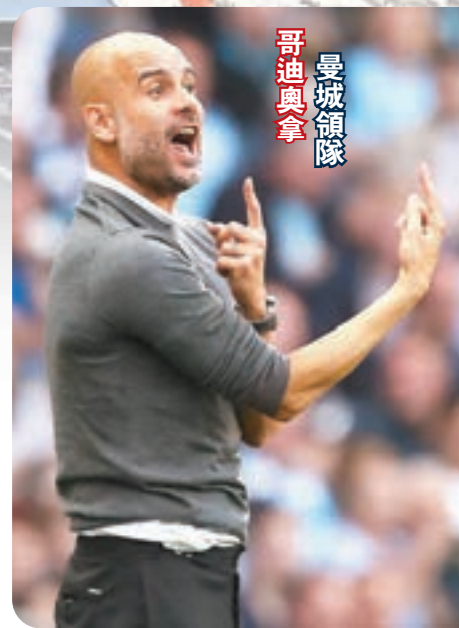
曼城領隊 哥迪奧拿