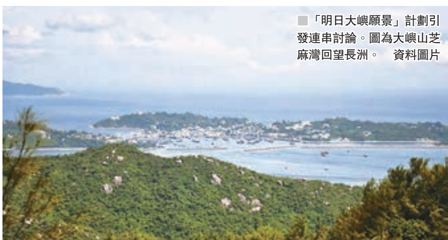
「明日大嶼願景」計劃引發連串討論。圖為大嶼山芝麻灣回望長洲。

至於對使用填海物料供應的顧慮，學會解釋，可供選擇填料包括從開山得來的泥土、由海床得來的海砂、人造砂及城市產生的惰性拆建物料等。從工程角