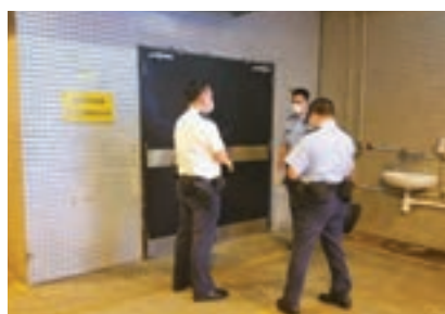
警員到停屍間初步調查無可疑。

因擔心血壓問題而不敢做運動。醫生指出，高血壓病人只要掌握正確運動技巧，也能如常人一樣進行緩跑步、游泳及行山等運動，步行及伸展運動更有助降低血壓水平，有研究證實高血壓病人進行帶氧運動，可改善血管彈性，對病情有幫助。