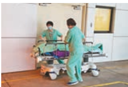
事主遺體送停屍間等待進一步檢驗死因。