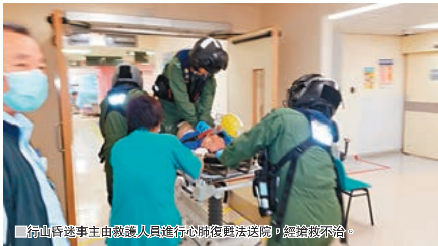
行山昏迷事主由救護人員進行心肺復甦法送院，經搶救不治。

香港文匯報訊(記者 蕭景源、劉友光) 上水流水響發生行山猝死意外。一名患有高血壓中年男子，昨日與同事行山期間突然不適昏迷，傷者由直升機送院搶救不治；警方列作「行山人士求警協助」案處理。近期消防處製作三齣「任何仁」宣傳短片，鼓勵市民在救護員到場前為病人急救，可把握救人黃金5分鐘時間(見另稿)。