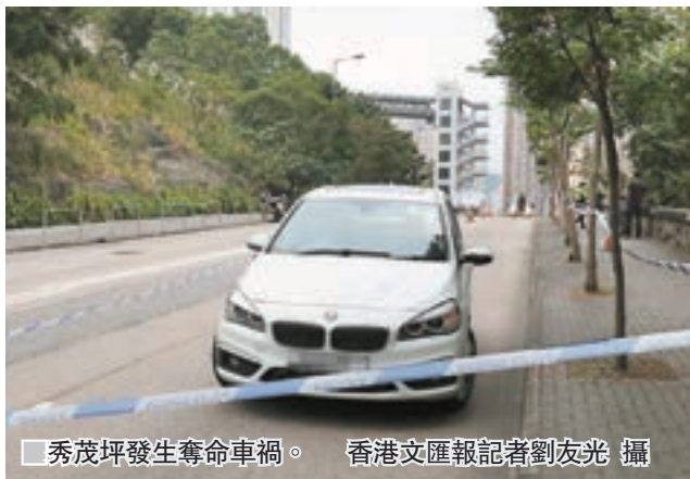
秀茂坪發生奪命車禍。

香港文匯報訊(記者 蕭景源) 秀茂坪道發生奪命交通意外，一名婦人橫過馬路時，被一輛駛經私家車撞至飛彈回行人路，猛撼路旁樹幹倒地昏迷，經送院搶救終不治。涉事私家車司機因涉嫌危險駕駛引致他人死亡被捕，警方正調查意外原因。