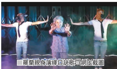
羅蘭親身演繹回訣歌網盤截圖