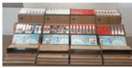
香港海關在深圳灣管制站檢獲約三十萬支懷疑私煙。

香港文匯報訊(記者 蕭景源) 一輛跨境貨車暗藏私煙，前日(9日)取道深圳灣管制站入境，但遭海關截查揭發，檢獲共值約79萬元的私煙，涉案司機當場被捕扣查。