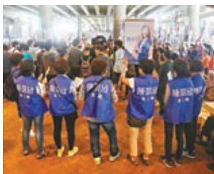
義工團到場支持，現場聲勢浩大。