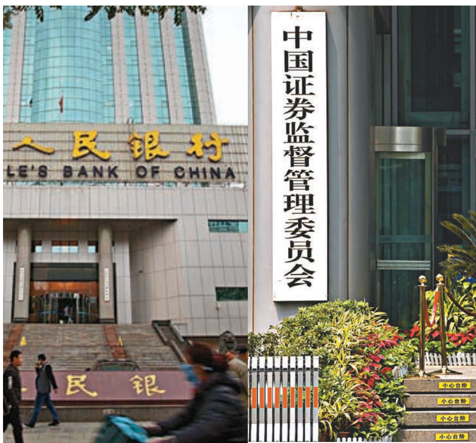
■ 民企「融資難融資貴」問題今年備受關注,中國人民銀行和中國證監會近日齊齊明言會再推支持民營企業融資的措施。

中證監也修改對上市公司融資行為的監管要求。允許前次募集資金基本使用完畢或募集資金投向未發生變更且計劃投入的上市公司,申請增發、配股、非公開發行股票不受18個月融資間隔限制,但相應間隔原則上不得少於6個月。