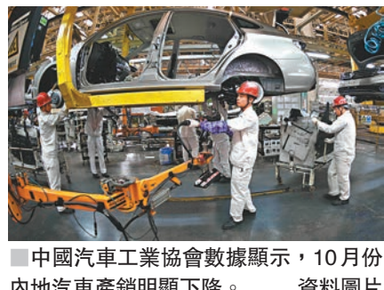
■ 中國汽車工業協會數據顯示,10月份內地汽車產銷明顯下降。 資料圖片

而中國汽車工業協會發佈的數據顯示,10月份內地汽車產銷比上月同期明顯下降,延續了7月份以來的低迷走勢。