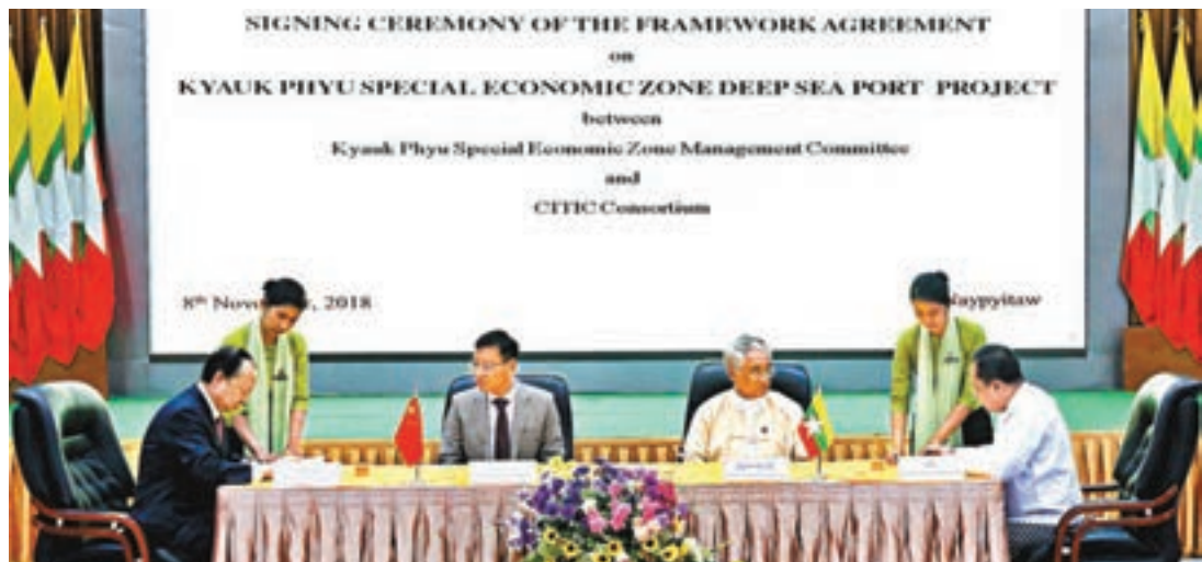
■當地時間8日，中緬代表在緬甸內比都簽署皎漂深水港項目框架協議。

上周，緬甸媒體率先透露了雙方於本周簽署協議的消息。《緬甸時報》當時稱，雙方已就中方企業在該項目中的股權佔比問題達成共識。雙方一致同意投入13億美元建設深水港項目第一階段。