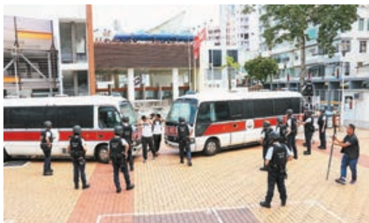
▲警員護送傷者離開球場。

香港文匯報訊(記者 蕭景源、劉友光)警方昨晨在旺角大球場進行代號「日塔」大型反恐演習，模擬大球場舉行有約 3,000 名觀眾入場的國際足球賽事期間，一名觀眾入場時被發現攜帶利刀，隨即有多名蒙面恐怖分子乘車抵達衝入球場，會合早已滲入觀眾席的恐怖分子，不斷向觀眾及警員開槍襲擊。警方接報出動反恐特勤隊、衝鋒隊及警犬等到場，最終成功制服恐怖分子，演習同時模擬疏散觀眾離開球場的秩序。