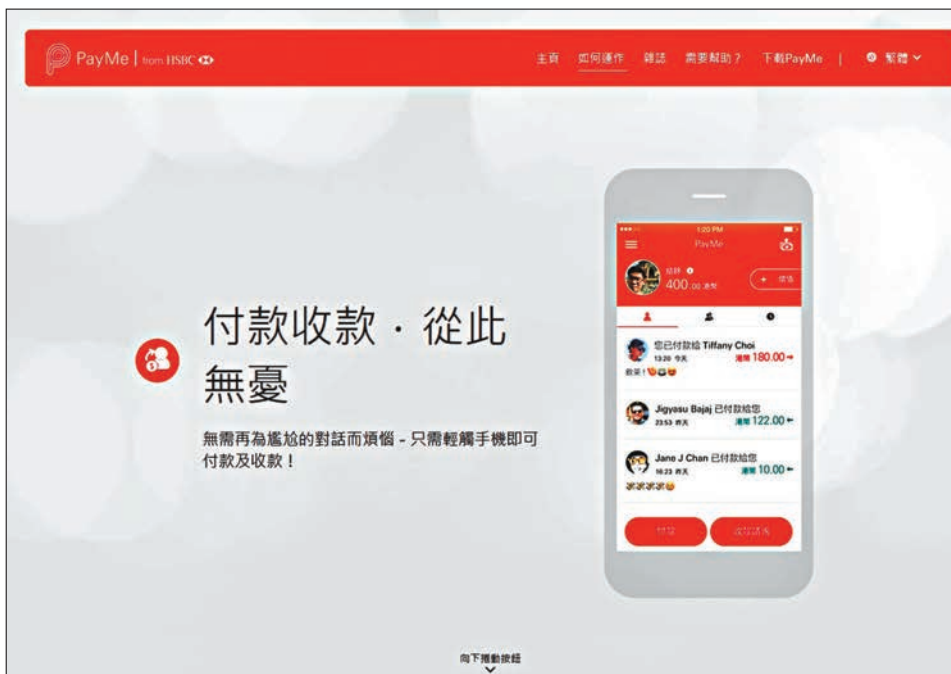
匯豐 PayMe 遭入侵盜賬，20 客戶受影響。圖為 PayMe 網站。 網頁截圖

民建聯立法會議員葛珮帆認為事態嚴重，反映銀行對電子賬戶及其他新式電子支付工具安全性沒有充足的保障。她指出，業界估計用戶使用與 PayMe 戶口相同的電郵、密碼等個人資料，用於其他網上服務從而洩露，不法分子在取得用戶密碼和個人資料後，通過「撞庫」的手段登入用戶戶口，再以 P2P 方式轉走款項。葛珮帆建議銀行檢視其安全機制，進一步