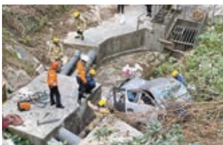
▲客貨車飛墮約 30 米下山坡。

消息稱，昨午約 4 時，一輛載有凍肉及貨物的客貨車沿舊山頂道往中環方向，其間駛至近地利根德里交界時，客貨車疑高速失控撞毀路邊約 1 米高石壘翻滾落近 30 米下山坡，全車嚴重損毀，車內雜物拋出車外散滿山坡，姓謝司機受傷被困車廂，途