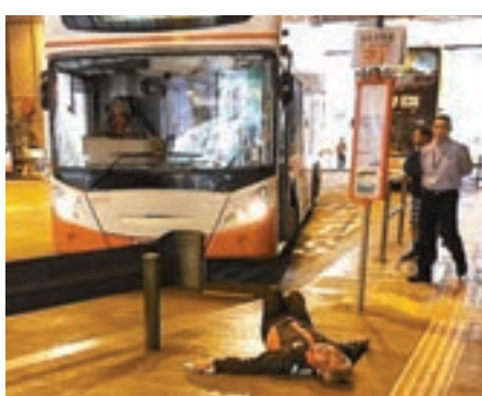
▲遇襲巴士站職員受傷倒地在涉事巴士前。

事發於昨晨約 11 時半，一輛往荃灣的 E31 路線龍運巴士自逸東巴士總站剛開出，一名婦人疑趕搭不及，不甘目送巴士離開，竟衝前站在巴士車頭攔阻，車長惟有停車，再通知站頭職員到來處理。兩名職員上前勸止期間與婦人發生爭