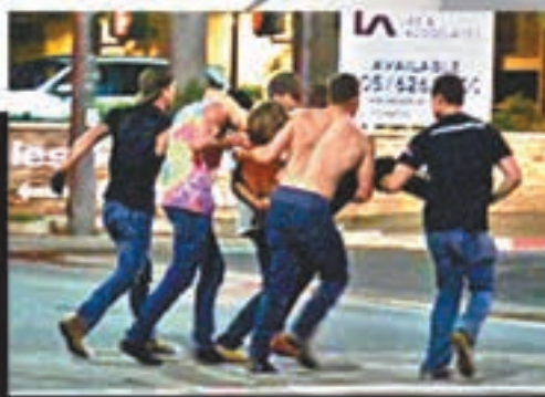
顧客及途人合力將傷者抬走。