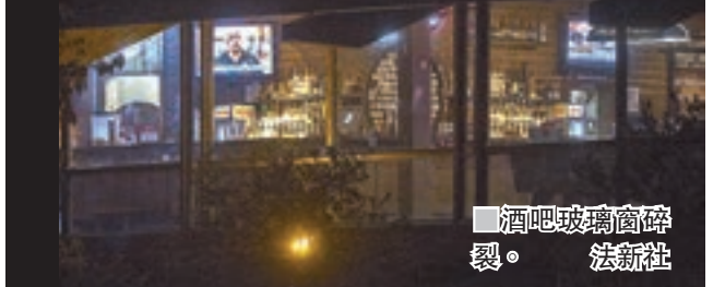
酒吧玻璃窗碎裂。