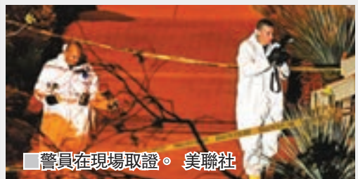
警員在現場取證。