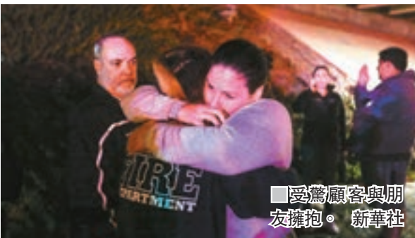
受傷顧客與朋友擁抱。新華社