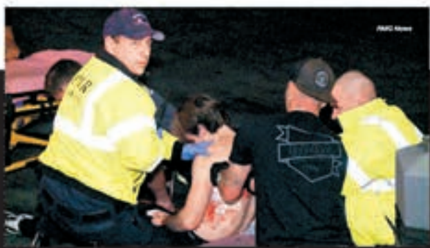
救護員即場治理傷者。