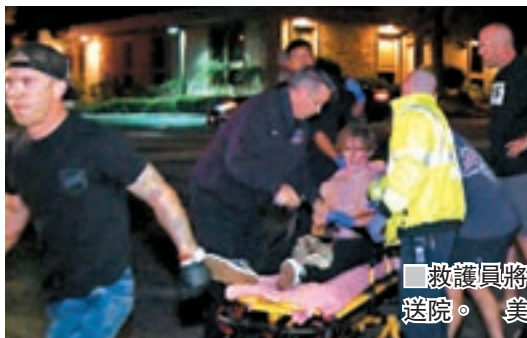
救護員將傷者送院。