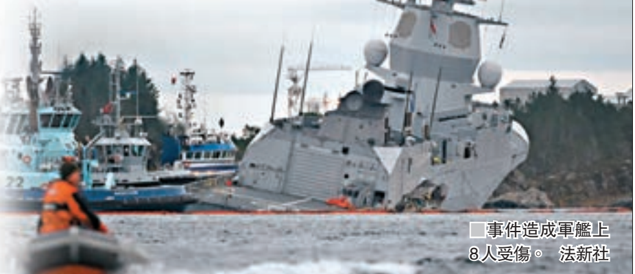
事件造成軍艦上8人受傷。