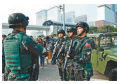
澳門政府首次聯同駐澳部隊演練。