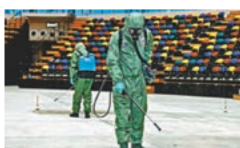
駐澳部隊主要負責檢測及洗消放射性污染。

香港文匯報訊(記者 鄭治祖)澳門警察總局昨日首次聯同解放軍駐澳門部隊,並協調澳門海關、治安警察局、司法警察局、消防局等多個部門及機構,在俗稱「澳門蛋」的東亞運動會體育館進行大型反恐演練,增強跨部門間的聯動機制,提升應對突發公共事件的能力。警察總局指演練過程十分順利,達到了預期效果。