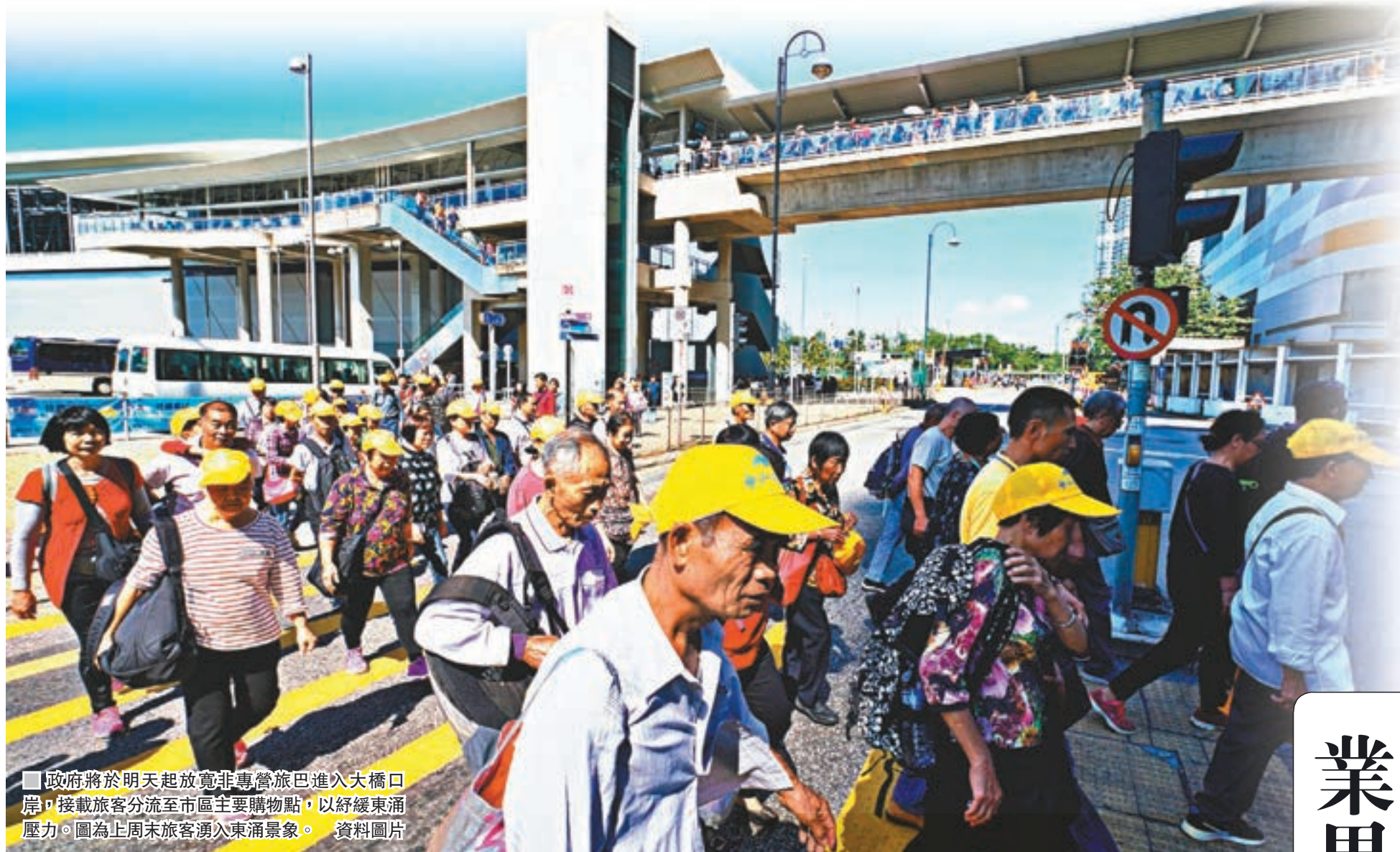
政府將於明天起放寬非專營旅巴進入大橋口岸，接載旅客分流至市區主要購物點，以紓緩東涌壓力。圖為上周末旅客湧入東涌景象。資料圖片

香港文匯報訊（記者 鄭治祖、文森）港珠澳大橋開通後，過去兩個週末出現大批內地旅行團「迫爆」東涌情況，對區內設施構成沉重壓力，居民日常生活亦受到影響。民建聯立法會議員、離島區議員周浩鼎透露，政府將於明天起採取新交通措施，容許非專營旅遊巴士在大橋香港口岸，接載旅客往返市區的主要購物點，希望新安排能達到分流效果，令旅客不再集中在東涌。旅遊界立法會議員姚思榮表示，政府將放寬旅遊業界預早申請在口岸泊位上客的限制，相信新措施可紓緩東涌的公共交通壓力。