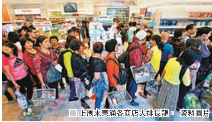
上周末東涌各商店大排長龍。