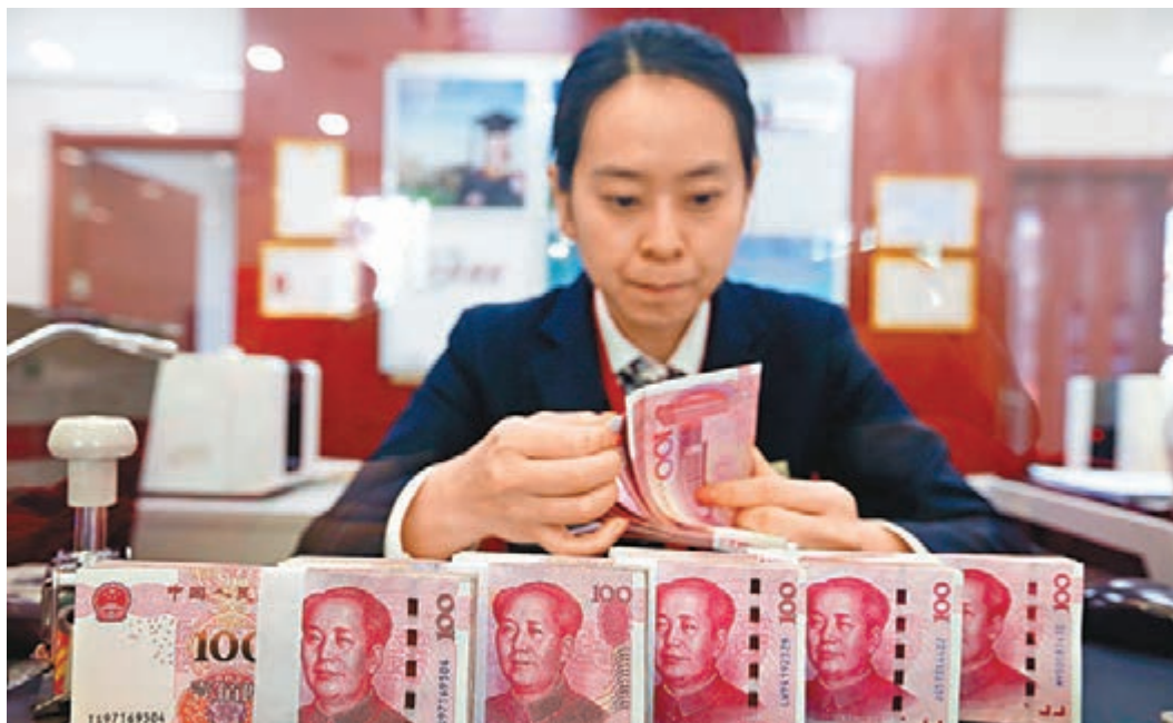
中國10月外儲按月跌339億美元

對於人民幣走勢,曹譽波認為當前市場對人民幣貶值的預期仍然較強,年內美聯儲仍將有一次加息,短期內將維持強勢美元的行情。如果未來美元指數繼續走強,人民幣匯率也可能會破7,