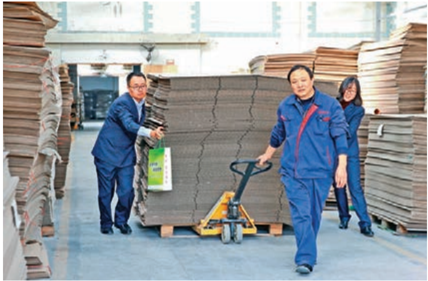
郵儲銀行為滁州市百之源工貿有限公司提供貸款支援,緩解企業融資難。

南京吉佳新材料科技實業有限公司是一家主要從事新型節能產品和環保節能工程的企業。2017年,企業進入技術項目投入期,融資成本高、貸款額度不足成