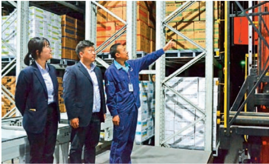
郵儲銀行為四川科倫藥業提供綜合金融服務

了解到該企業情況後,郵儲銀行第一時間主動上門走訪,根據企業實際情況,向企業推薦了一款融資新品——「小微易貸」。企業主喜出望外,隨即向郵儲銀行提出了正式申請。僅用了半個工作日,郵儲銀行便成功向其發放了小微易貸稅務模式貸款100萬元,無需提