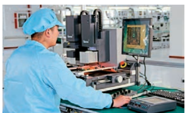
郵儲銀行支持南京吉佳新材料科技實業有限公司轉型升級

下一步,郵儲銀行將深入研習民營企業金融需求,盡快出臺郵儲銀行支持民營企業發展的指導意見,持續加大對民營企業發展的金融支持力度,為民營企業「心無旁騖創新創造,踏踏實實辦好企業」創造更加健康的環境。