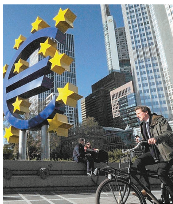
圖為法蘭克福「歐元塔」的巨型歐元雕塑。資料圖片

技術走勢所見，經歷了四至五月份的挫跌後，自六月至今，歐元兌美元區間橫盤的態勢中，值得注意的是其間多次上探1.18附近的阻力水平不果，最近一趟的上試就在九月下旬，在無功而還之下，下跌至目前接近1.13關口，亦即逼近於八月份創出的年內低位1.1297，倘若再跌破此區，或將引發又一輪下跌走勢。 黃金比率方面，以2017年起始的累計漲幅計算，61.8%的回調水平為1.1198；關鍵支撐將直指1.10這個心理關口。上方阻力回看25天平均線1.1460以及1.1620水平。 美元兌加元走勢，圖表走勢所見，MACD指標上破了訊號線，有望匯價續呈走穩。而自10月初低位觸及1.2778後，匯價至今一直穩步回升，倘若本周仍可企穩於1.30關口上方，料美元兌加元將可繼續反撲。黃金比率計算，50%及61.8%的回升幅度為1.3080及1.3155水平。估計較關鍵的阻力則為1.33關口。至於下方支撐預估在250天平均線1.2870及1.2770水平。