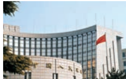
■人民銀行發表的工作論文認為，應在持續研究和試驗的基礎上理性客觀評估區塊鏈「能做什么、不能做什么」。資料圖片

香港金融管理局早前公佈，新推出的貿易融資數碼化平台「貿易聯動」(eTrade Connect)將與歐洲同業we.trade對接，構建全球首個跨地區及跨國境貿易融資平台。