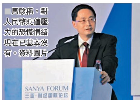
■馬駿稱，對人民幣貶值壓力的恐慌情緒現在已基本沒有。

長潘功勝亦表示，人民幣國際化是市場驅動的過程，而在比較中國內地金融市場的體量和境外投資者的需求，尤其是目前整個內地債券市場託管量已經超過70萬億元，然而境外投資者投資境內債券市場佔比只有2.4%，遠低於發達國家20%的水平，相信境外投資者投資內地金融市場還有很大的空間。