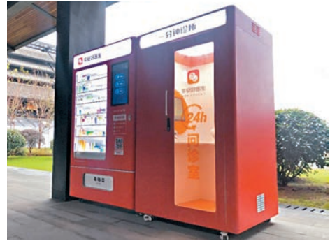
「一分鐘診所」包含「獨立問診室」和「智能藥櫃」兩大功能模塊。

香港文匯報訊（記者 蔡競文）隨着科技進步，無人化逐漸普及，甚至現在連醫生都可以無人化。平安好醫生（1833）昨日就在烏鎮景區推出其研發的內地首個商業化運營的無人診所——「一分鐘診所」，通過 AI 及大數據，能夠辨識超過 2,000 種常見疾病。平安好醫生預計，至今年底，「一分鐘診所」將在全國落地超過 1,000 家。