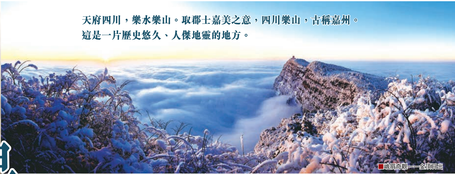
■峨眉奇觀——金頂日出