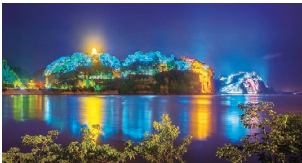
■樂山新推出的「夜遊三江」旅遊項目，受到遊客熱捧。