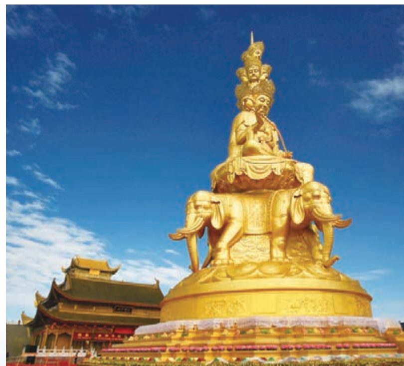
■位於峨眉山金頂的十方普賢金像