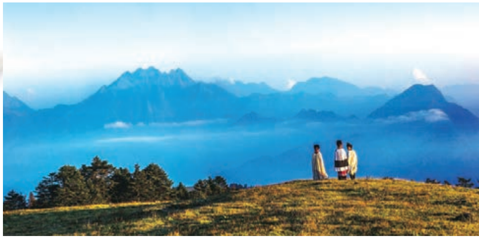
■神秘的黑竹溝，中國的「百慕大」。