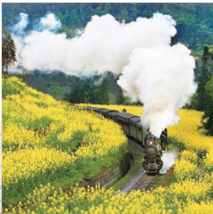
■工業革命的活化石——樂山犍為縣的嘉陽小火車