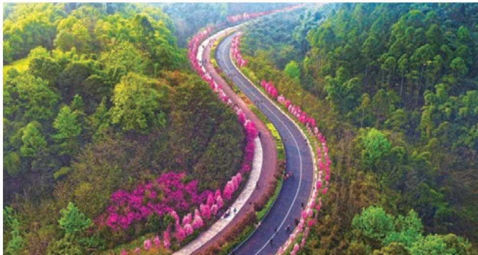
■城市綠心——位於樂山城區，面積近十平方公里。