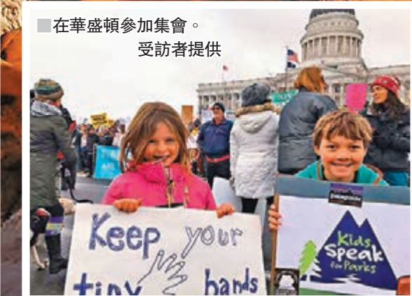
在華盛頓參加集會。