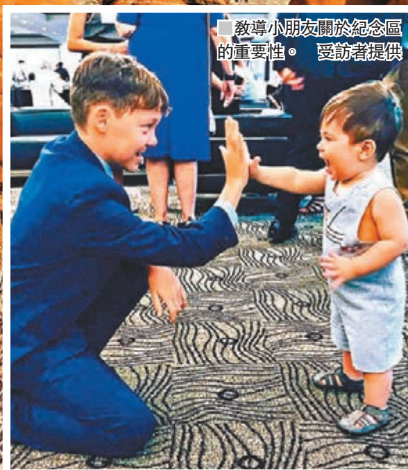
教導小朋友關於紀念區的重要性。