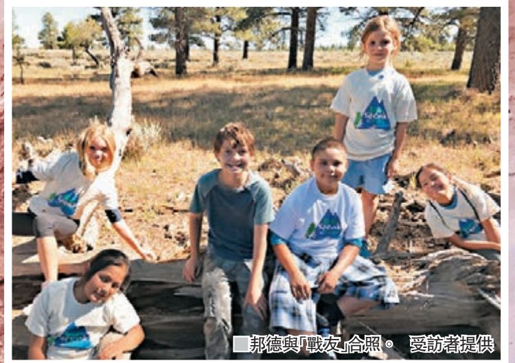
邦德與「戰友」合照。