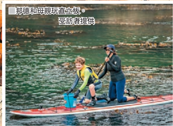
邦德和母親玩直立板。