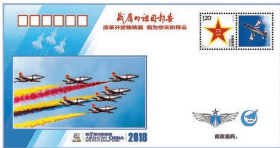
■ 中國空軍《戰鷹向祖國報告》主題紀念封之五。