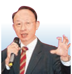
黎偉成 資深財經評論員