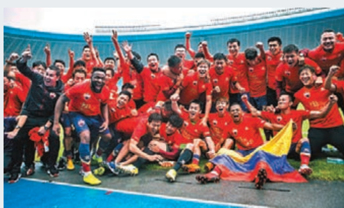
榮歸 主場作戰的深圳佳兆業3日晚在中甲最後一輪賽事中以5:0大勝浙江毅騰,以聯賽第二名的身份成功衝超,時隔七年再次回到頂級聯賽。