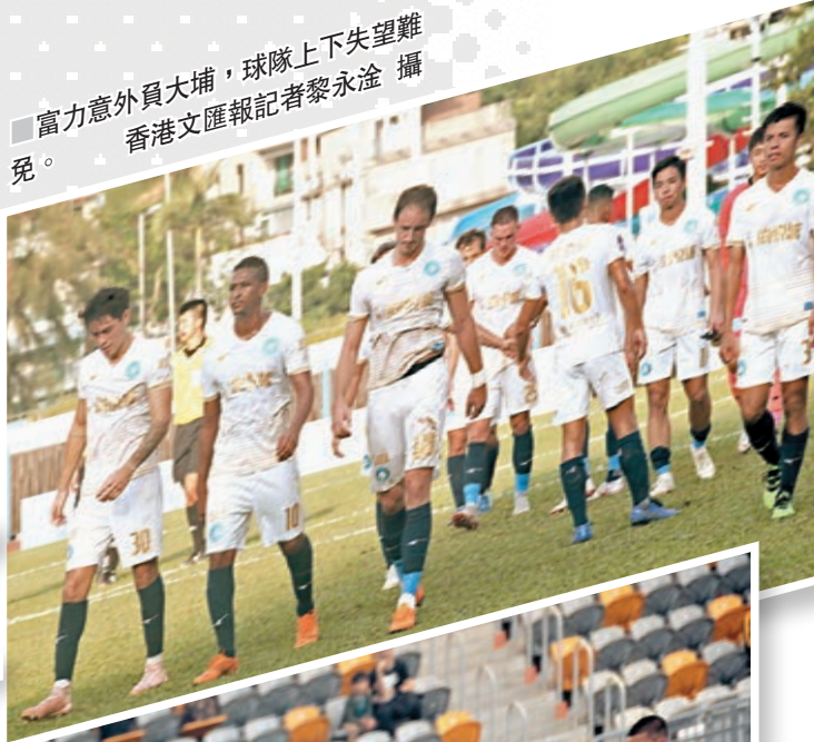
富力意外負大埔,球隊上下失望難免。

完成第6周賽事後,5戰13分的東方龍獅佔據榜首,同分但多賽一場的冠忠南區排第2,香港飛馬6戰10分排第3,第4至6位為同得9分的大埔、傑志及富力。