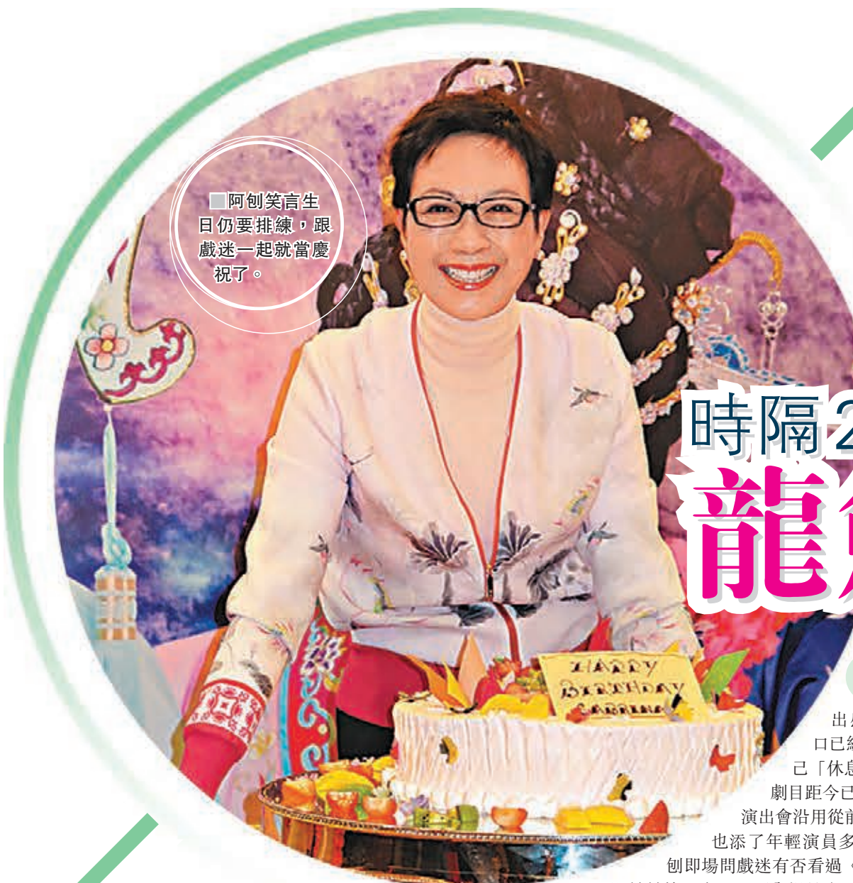
阿創笑言生日仍要排練，跟戲迷一起當慶祝了。