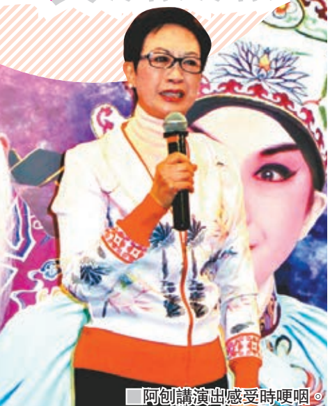
阿創講演出感受時哽咽。

談到生日如何慶祝？阿創笑言生日仍要排練，昨日跟戲迷一起當慶祝了，不過都會吃餐飯，只是無甚特別。另問到排練時會否邀請師父仙姐白雪仙來監場指導一下？阿創即表示：「綵排我不敢驚動她老人家，只是會問她來不來看我演出。」這趟從加拿大回港，阿創表示亦已經上門探望過仙姐，提到任姐任劍輝快將106歲冥壽，阿創指他們一班學生會上仙姐家謝茶鞠躬，且每年如是，自己如在香港，也必定會去懷念恩師。