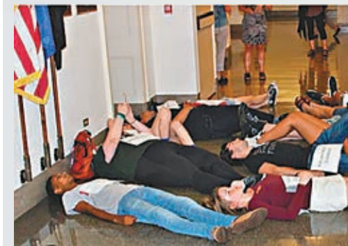
內韋特曾參與的各種示威活動。