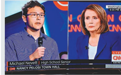
內韋特曾在電視上質問民主黨眾議院少數派領袖佩洛西，為何未有推動有意義的槍管法案。