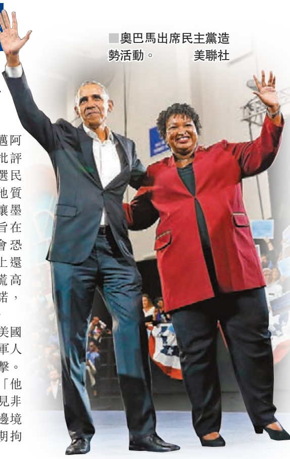
奧巴馬出席民主黨造勢活動。

特朗普周四宣稱，一旦衝擊美國邊境的非法移民向美軍擲石，軍人應視對方持有步槍，可開火還擊。他前日改口稱美軍不會開槍，「他們不需要開火，我只是不想看見非法移民擲石」，但指出在美墨邊境申請庇護的非法移民將遭長期拘留。