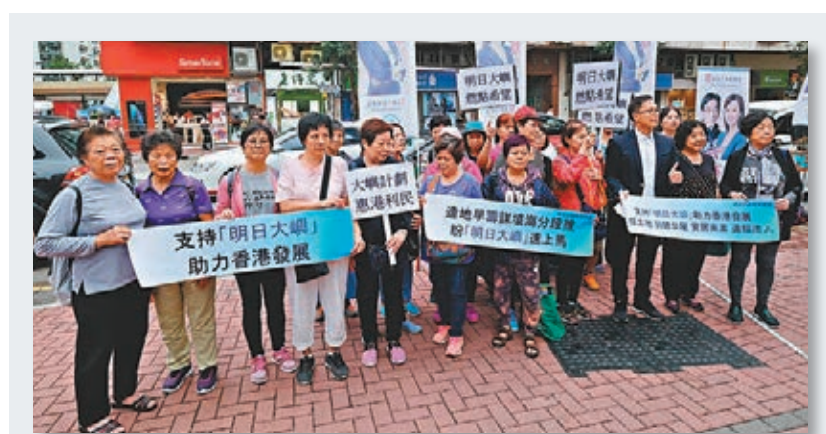
支持填海團體「明日大嶼願景聯盟」10多人昨日集會，支持施政報告提出的「明日大嶼」計劃。他們高呼「大嶼計劃，惠港利民」、「明日大嶼，燃點希望」、「填海建島，安居有望」等口號，並表示「明日大嶼」可以開發新土地、興建公屋，讓港人安居樂業，更助力香港發展，盼望計劃盡快上馬。文：鄭治祖

「新民主同盟」荃灣區議員譚凱邦日前在facebook發帖，聲言旅發局在東京舉辦大灣區展覽是「出賣港人」，「大佬，香港同大灣區根本就唔同，香港係香港，『大陸』係『大陸』，一個明明係推廣香港嘅活動，點解會拉得大灣區？到底啲家叫人嚟香港定去『大陸』？呢班友為咗拍馬屁，出賣香港人利益，極可恥。」